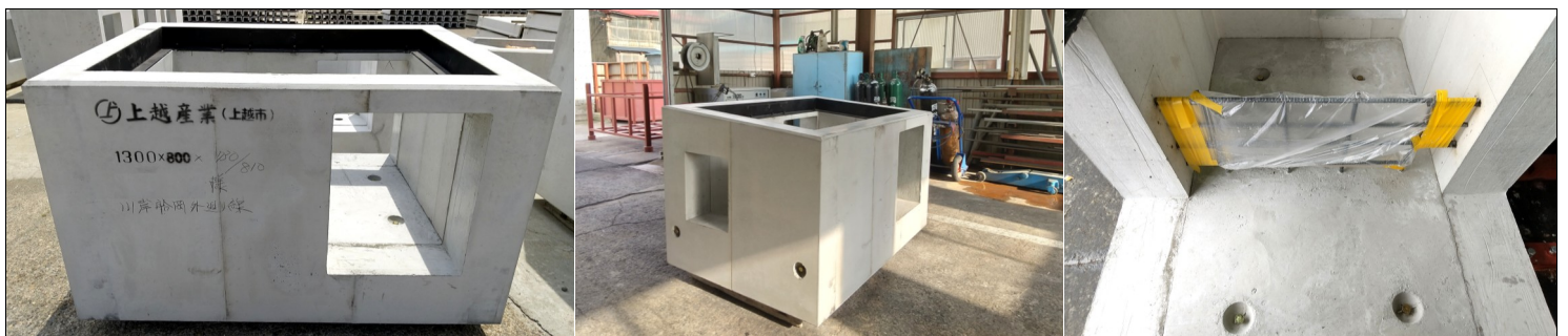
1300×800角 受枠・勾配・仕切り板用鉄筋付き